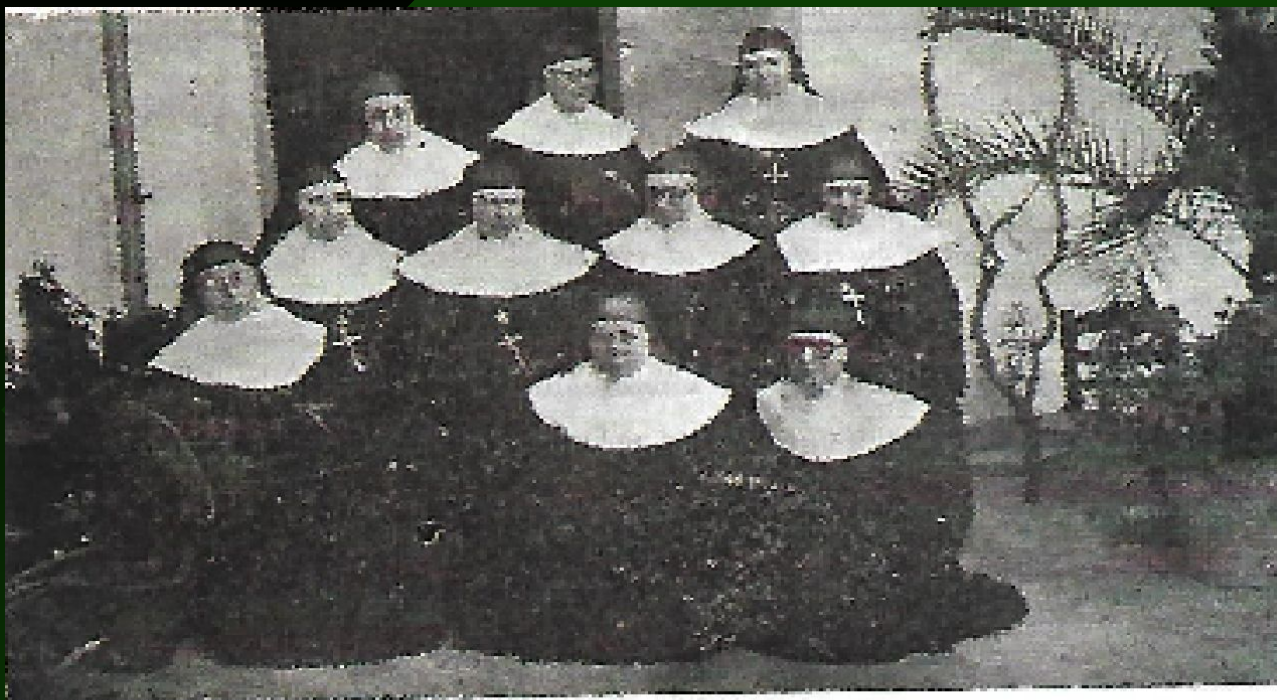
Recorte de una revista con las misioneras que formalizan la Comunidad de nuestra Casa-Colegio de Frente de Santos.