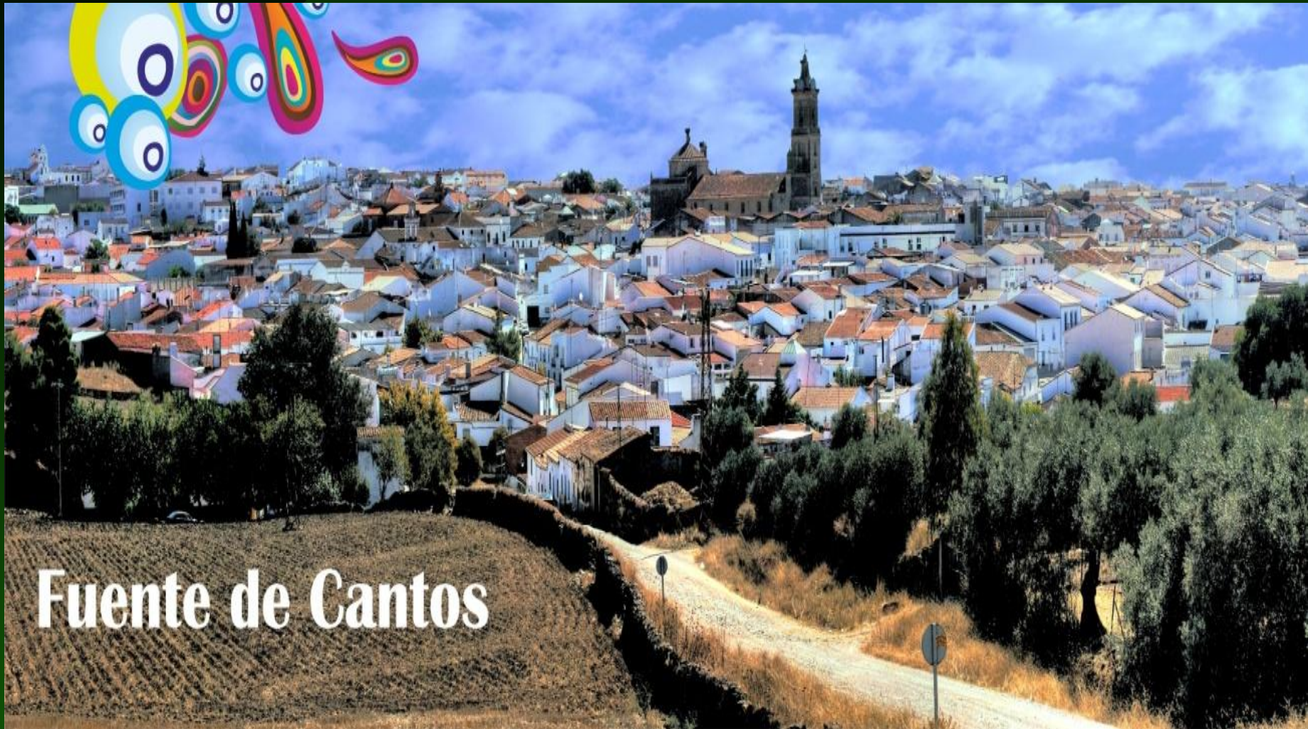
Fuente de Cantos